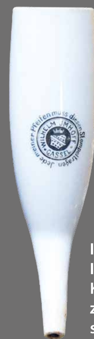
Innenseite einer Porzellanpfeife: Imhoffs Stempel mit gekröntem Kasseler Stadtwappen auf schwarzem Grund. Die Stadt Kassel schrieb sich bis 1926 mit „C“