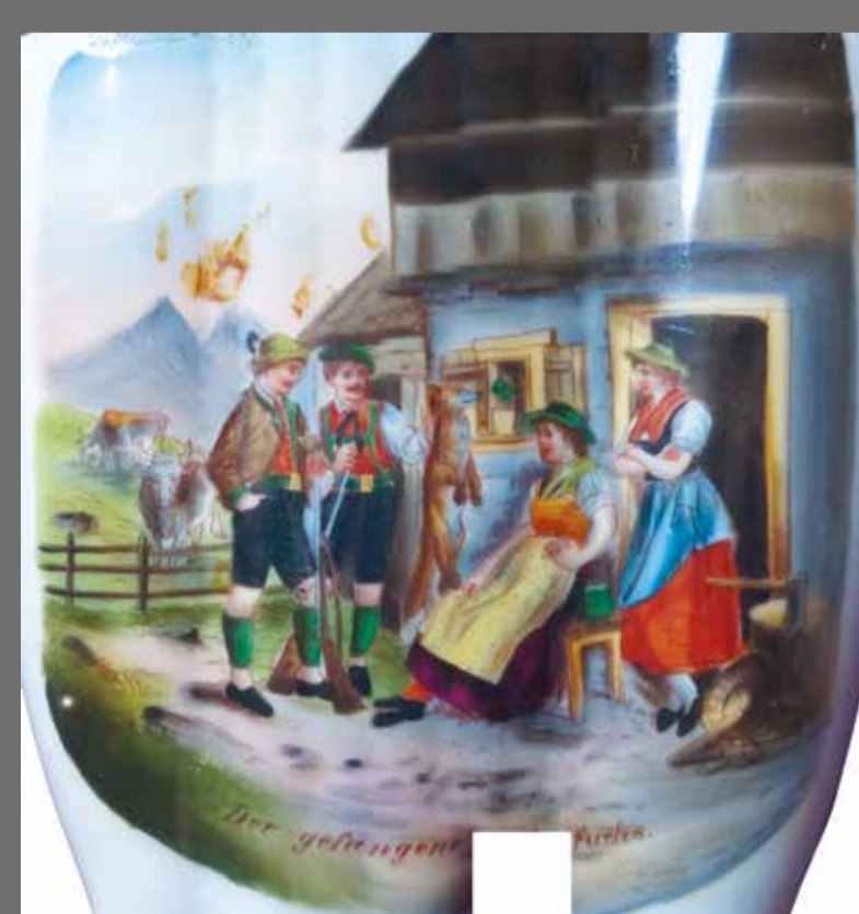
Imhoff-Pfeife M ca. 1:1 Pfeifenkopf mit Druck „Der gefangene Fuchs“.