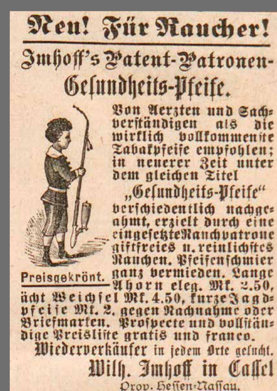
Überregionale Werbung für Imhoff-Pfeifen im Beiblatt der Fliegenden Blätter oben 1884, unten 1893