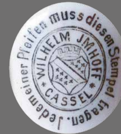
Marke der Pfeifenfabrik Imhoff: „Jede meiner Pfeifen muss diesen Stempel tragen. WILHELM IMHOFF *CASSEL*“ mit Kasseler Wappen. M 2:1