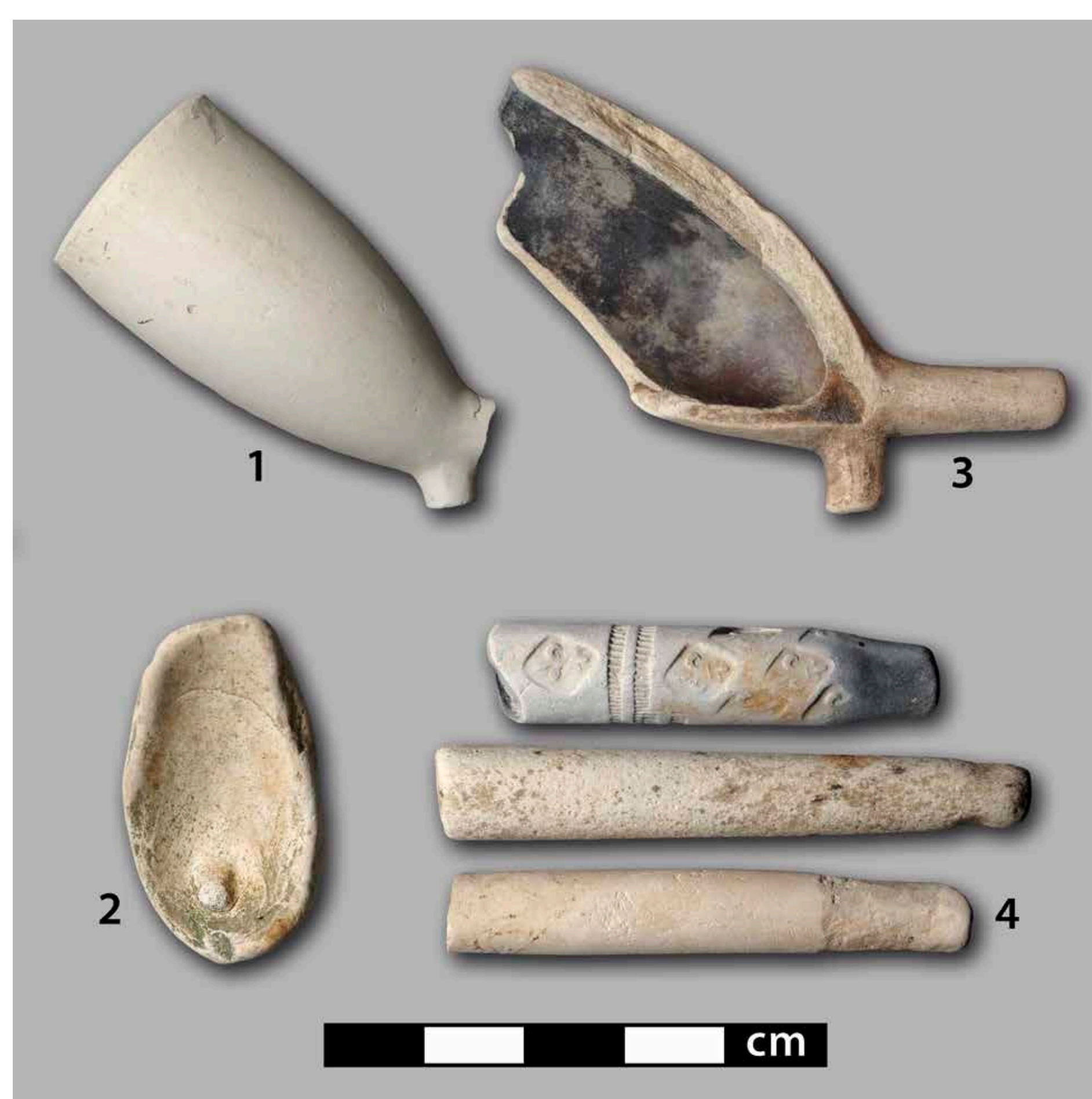
Relikte verschiedener „Lebensstadien“ der Tonpfeifen: 1. produktionsfrisches Kopffragment; 2. Fehlprodukt, Rauchkanal nicht durchgestochen; 3. Kopffragment mit deutlichen Tabakkondensat-Ablagerungen; 4. Stiel-Endstücke mit Biss Spuren bzw. sekundärer Bearbeitung.