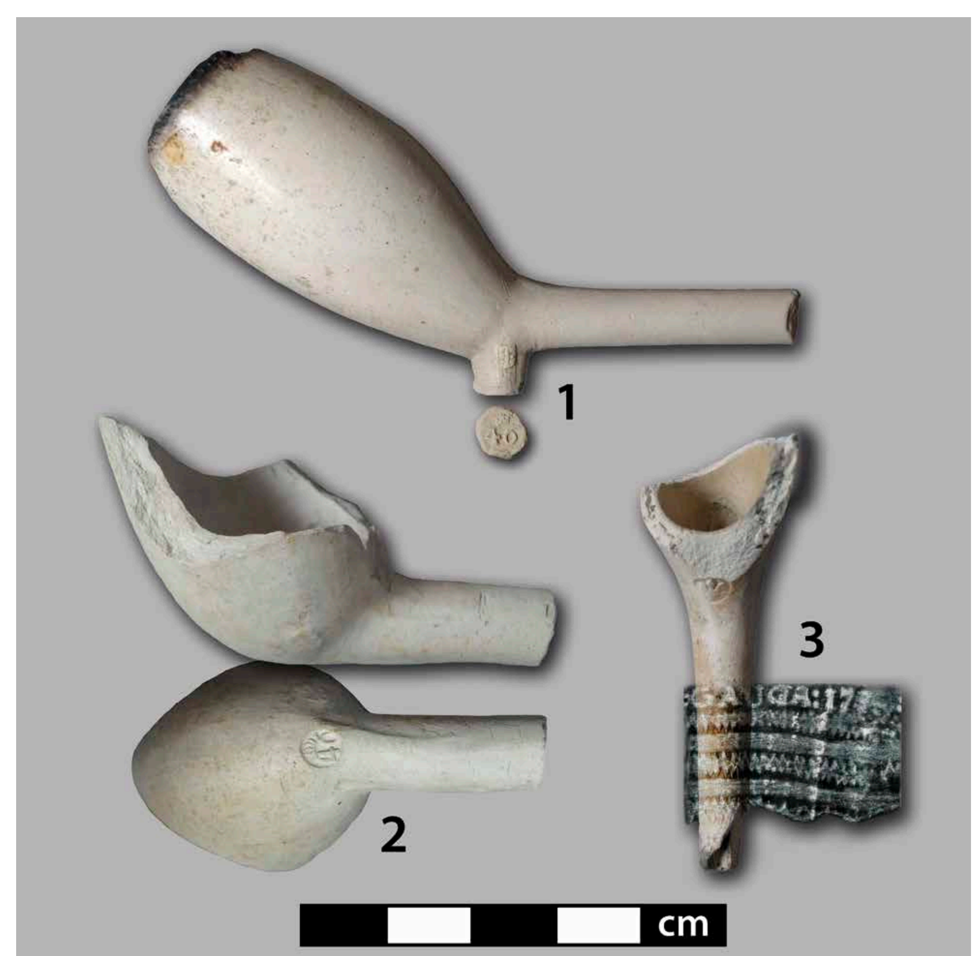
Original und Fälschung: 1. Pfeife des Basistyps 3 mit gekrönter 46 als Fersenmarke und Gouda-Wappen als Fersenmarken, Mitte 18. Jh. Unten Westerwälder Plagiate: 2. Rundbodenpfeife/Basistyp 5 mit gekrönter 46 als Bodenmarke und imitiertem Gouda-Wappen als Bodenseitenmarke, spätes 19. Jh.; 3. Rundbodenpfeife mit imitativem Stieltext „GAUDA:173?“.