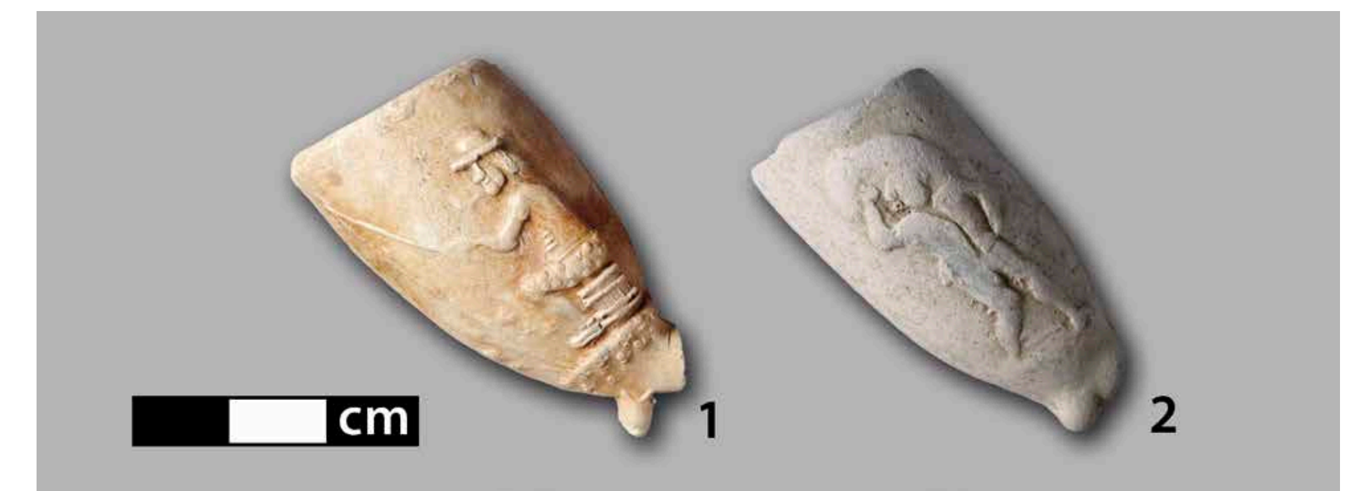
Pfeifenköpfe mit Reliefs alltäglicher Szenen: 1. Pfeiferauchender Angler in modisch gepunkteter Hose; 2. mehltragender Müller. Basistyp 2, 1. Hälfte 18. Jh.